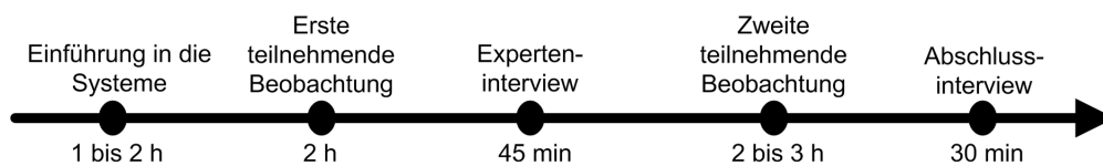
Abbildung 1: Ablauf der Untersuchung vor Ort

Im Beitrag wird zur Erhebung des Nutzungskontextes eine Mischung aus Aufgaben- und Systemorientierung gewählt, folglich ein Methodenmix aus Cognitive Work Analysis und Contextual Design (Beyer & Holtzblatt 1998). Die Cognitive Work Analysis bildete den theoretischen Rahmen – die konkrete Anwendung der Methode erfordert jedoch eine langwierige und tiefgreifende Auseinandersetzung mit dem System. Gerade für einen querschnittlichen Vergleich mehrerer Domänen schienen daher die Instrumente des Contextual Design – teilnehmende Beobachtungen und Experteninterviews – besser geeignet. Insgesamt wurden die jeweiligen Domänen zwischen sechs und acht Stunden vor Ort analysiert. Zwei Personen begleiteten die Erhebung, die jeweils im Wechsel die Rolle des Versuchsleiters und die des Protokollanten übernahmen. Diese Vorgehensweise wird von Rosenthal & Rosnow (2009) empfohlen, um Versuchsleitereffekte zu minimieren. Abbildung 1 gibt einen Überblick über den Ablauf der Untersuchung.