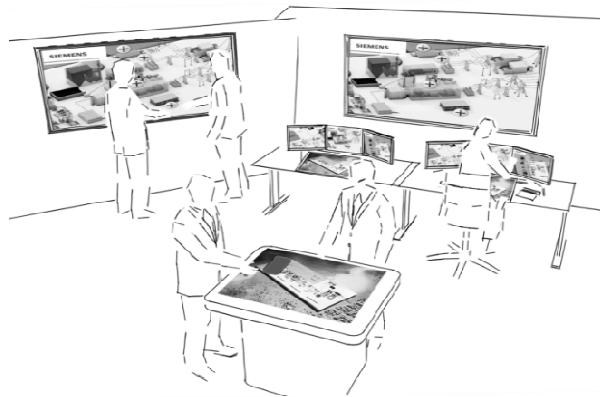
Abbildung 4: Die Idee der holistischen Arbeitsumgebung

chen simultane Eingaben mehrerer Personen und fördern damit kollaboratives Arbeiten. Durch die direkte Manipulation wird zugleich die Bedienung natürlicher. Weiterhin kann durch eine größere Visualisierung, zum Beispiel an großen Wandbildschirmen, kollaboratives Arbeiten bei Lagebesprechungen und Schichtübergaben unterstützt werden. Die Wandbildschirme könnten zusätzlich mit der sog. Ambient Light Technologie ausgestattet werden und beispielsweise je nach Status eine andere Farbgebung der Hintergrundbeleuchtung annehmen. So könnte sich im Störfall die Umrandung beispielsweise rot einfärben. Das neue Konzept einer holistischen Arbeitsumgebung sieht weiterhin vor, die Arbeitsabläufe durch ein mobiles Gerät (z. B. iPhone) zu unterstützen. Die Visualisierung der wichtigsten Meldungen auf diesen Geräten ermöglicht es, Aufgaben durchgängig an verschiedensten Orten auch abseits des eigenen Arbeitsplatzes verantwortungsvoll wahrzunehmen.