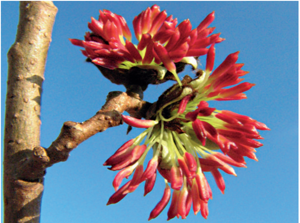
Abb. 12: Parrotia persica .

Nord-Iran und Vorderasien stammende, winterkühle Eisenholzbaum ist ein typisches Element der kaspischen Niederungswälder. Die Gattung Parrotia konnte fossil mit P. fagifolia , die als Vorfahr von P. persica gilt, auch im Obermiozän Mittel-Europas nachgewiesen werden (KRAMER 1974). Bäume dieser Art werden 10–12 m hoch. Im Gegensatz zu allen anderen Zaubernussgewächsen verträgt der Eisenholzbaum auch Kalkböden. Häufig wächst er als mehrstämmiger Großstrauch, der im Alter deutlich breiter als hoch wird. Seine Borke blättert dann in mehr oder weniger großen Platten ab. Junge Triebe sind zunächst behaart und verkahlen erst später. Der Baum hat keine echten Winterknospen. Den Schutz des Vegetationspunktes übernehmen kleine, stark hellbeige behaarte Laubblätter. Die wechselständigen, verkehrt-eiförmigen Blätter werden bis 15 cm lang und sind beiderseits sternhaarig. Im Austrieb sind sie meist orange bis rötlich gefärbt, vergrünen jedoch relativ rasch. Der