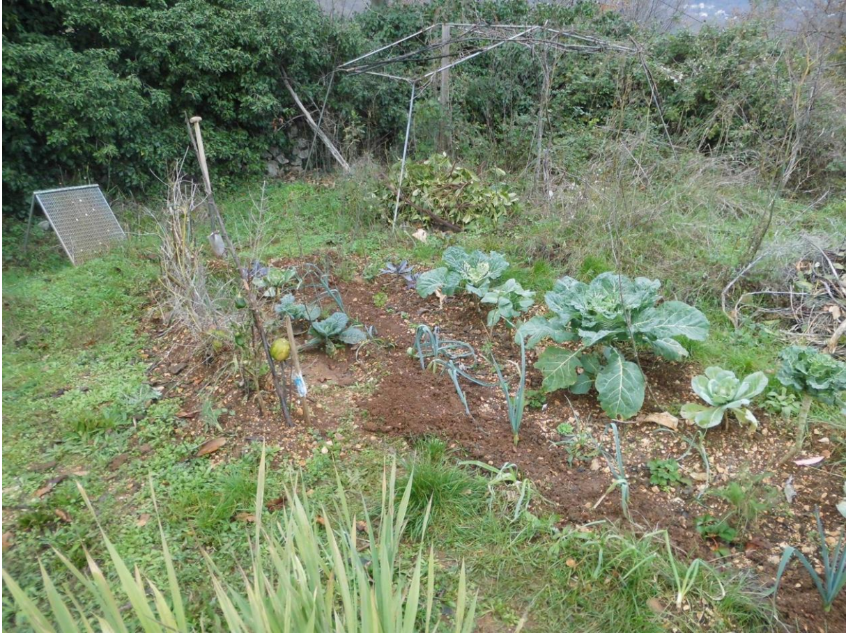
Gartele vor dem Grabe!