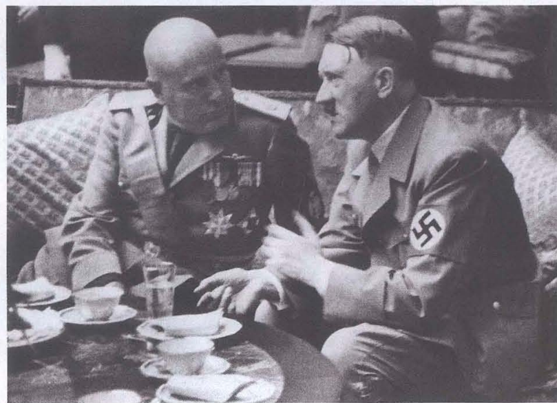
Gepflegter Austausch beim Kaffee: Hitler empfängt Mussolini Ende September 1937 im „Führerbau“ in München.

Eine Reihe von Bündnissen flankierte die „Achsen“-Allianz. Im April 1935 wurde ein Abkommen über deutsche Rohstofflieferungen nach Italien getroffen; ein Jahr später schlossen Heinrich Himmler und der italienische Polizeichef Arturo Bocchini einen Pakt für gegenseitige Hilfe bei der Unterdrückung ihrer Gegner. Ebenfalls 1936 wurde die deutsch-italieni-