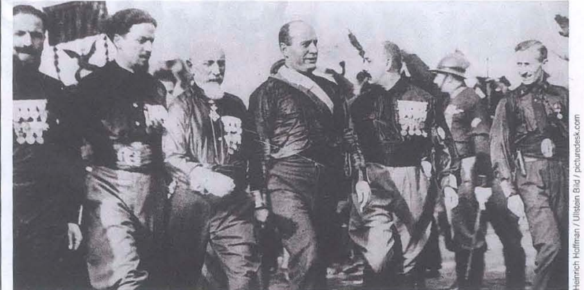
Mussolini beim „Marsch auf Rom“ 1922 – nur noch eine symbolische Geste.

Anfang der 20er-Jahre wurde der Faschismus in Italien für die Mittelschicht attraktiv – er war radikal nationalistisch und antiliberal, zeichnete sich aber vor allem durch gewaltsame Ausschreitungen gegen die Arbeiterbewegung aus. Schritt für Schritt wurde die Einparteiendiktatur aufgebaut.