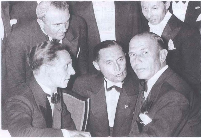
Auch diese beiden tauschten sich aus: Reichspropagandaminister Joseph Goebbels (l.) im Gespräch mit dem italienischen Propagandaminister Dino Alfieri (r.) während eines Empfangs im Zoo anlässlich der Olympischen Spiele in Berlin 1936.