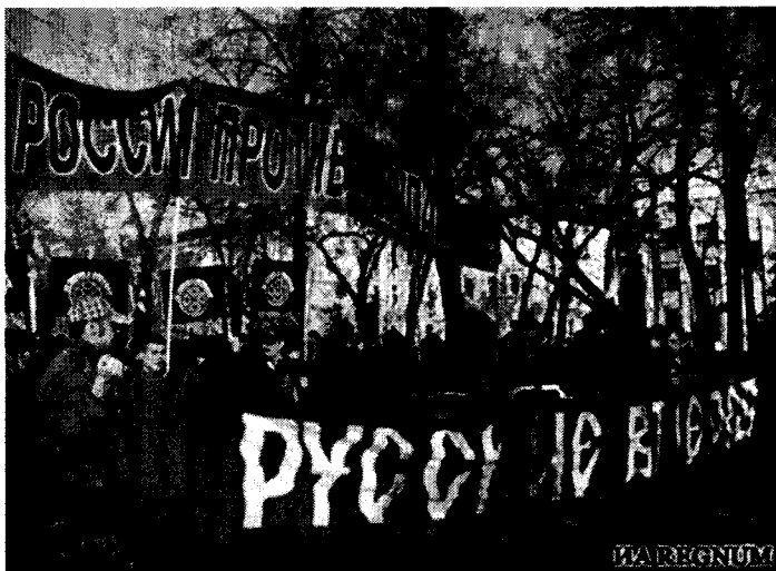
Abb. 4: Bild vom »Russischen Marsch« nationalistischer Kräfte 2005. Auf den Plakaten steht: »Russland gegen die Okkupanten« und »Russen vorwärts« ( http://www.regnum.ru/news/539412.html , angesehen am 20. 11. 2005)