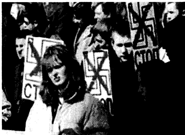
Abb. 5: Protest gegen nationalistische Kräfte 2006. Auf dem Plakat steht: »Stopp«. ( http://www.intomoscow.ru/modules.php?name=News&new_topic=21&pagenum=11 , angesehen am 22. 6. 2009)