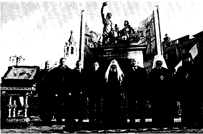
Abb. 3: Eröffnung des Denkmals für Minin- und Požarskij in Nižnij Novgorod durch Patriarch Aleksij II. anlässlich des »Tags der nationalen Einheit« 2005 ( http://www.eparhia.ru/pnews/?ID=1583 , angesehen am 12. 6. 2009)