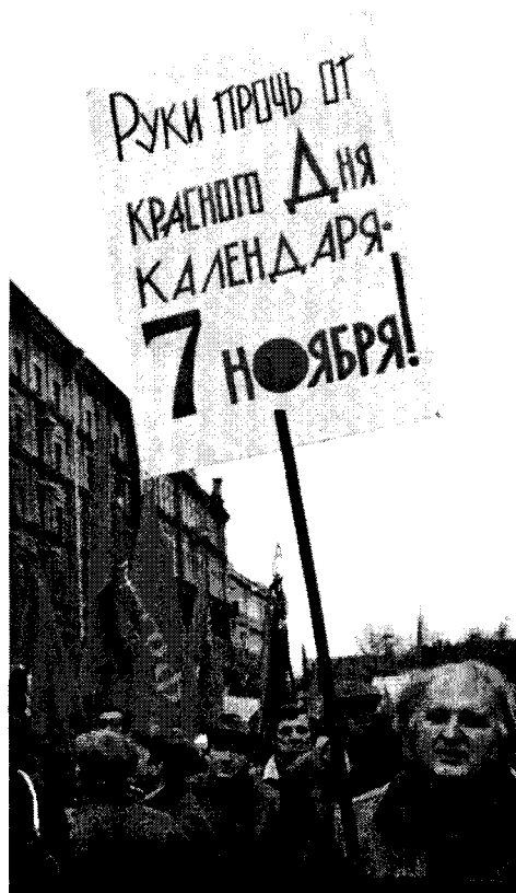
Abb. 1: Kommunistische Kräfte demonstrieren 2004 gegen die Abschaffung des Revolutionsfeiertags. Auf dem Plakat steht »Hände weg vom roten Tag im Kalender – vom 7. November!«

intendiert sind. Angesichts dieser komplexen Problemlagen bleibt abzuwarten, ob der Feiertagskanon in seiner heutigen Form über Putins Amtszeit hinaus Bestand haben wird.