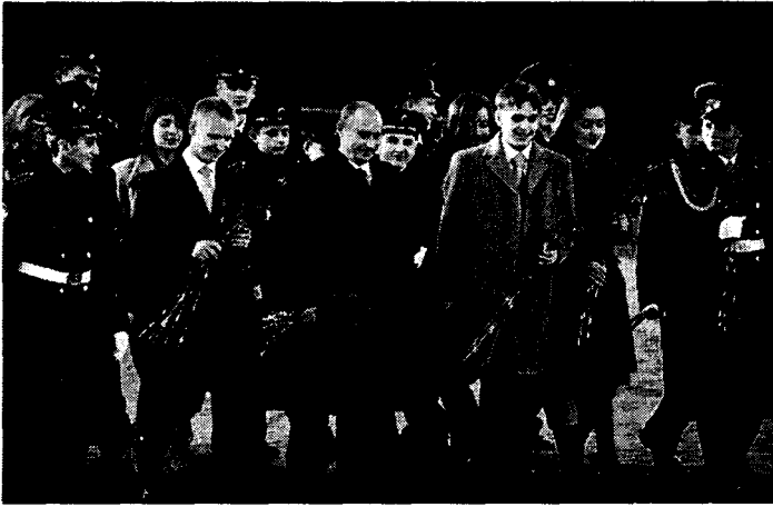
Abb. 2: Putin und ausgewählte VertreterInnen der Jugend Russlands auf dem Weg zum Denkmal für Minin und Požarskij auf dem Roten Platz (4. November 2005) ( http://www.kremlin.ru/text/images/96688.shtml , angesehen am 7. 10. 2007)