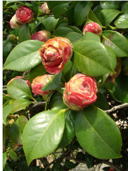
Abb. 12: Camellia japonica (Sorte), Frostschäden an Knospen (A. JAGEL).