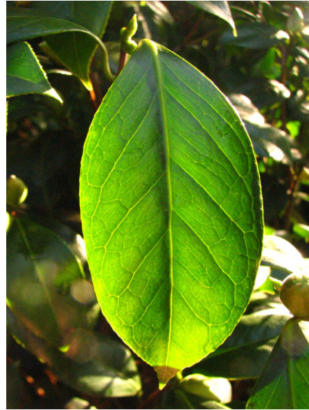
Abb. 4: Camellia japonica (Sorte), Blatt (V. M. DÖRKEN).

Die immergrünen, derb-ledrigen, beiderseits kahlen Blätter sind wechselständig angeordnet. Sie sind oberseits glänzend-dunkelgrün, unterseits heller. Bei Camellia japonica ist der Rand der breit eiförmigen bis eilänglichen Blätter mehr oder weniger stark gezähnt. Der Blattstiel ist kurz, die Blattbasis ist keilförmig (Abb. 4).