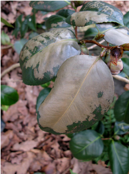
Abb. 11: Camellia japonica (Sorte), Frostschäden an Blättern.