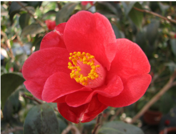
Abb. 5: Camellia japonica , Blüte der Wildform (V. M. DÖRKEN).

Die Blüten stehen endständig und meist einzeln, nur gelegentlich findet man zwei oder mehrere Blüten beisammen. Die im Durchmesser bis zu 5 cm breiten Blüten der Wildform der Japanischen Kamelie ( Camellia japonica , Abb. 5 & 6) sind kräftig rot gefärbt und erscheinen von (Februar-) März bis April (-Mai). Die Blüten haben 5-7 grüne Kelchblätter und ebenso viele Kronblätter. Auf die Kronblätter folgen zahlreiche Staubblätter mit leuchtend weißen bis cremefarbenen Staubfäden. Diese sind entweder bis zur Hälfte, zumindest aber an der Basis zu einer Röhre verwachsen. Der oberständige Fruchtknoten ist 3- (bis 5-) fächerig. Der Griffel ist lang und ragt etwas über die Staubblattröhre hinaus. Er endet in 3 (-5) Narbenästen.