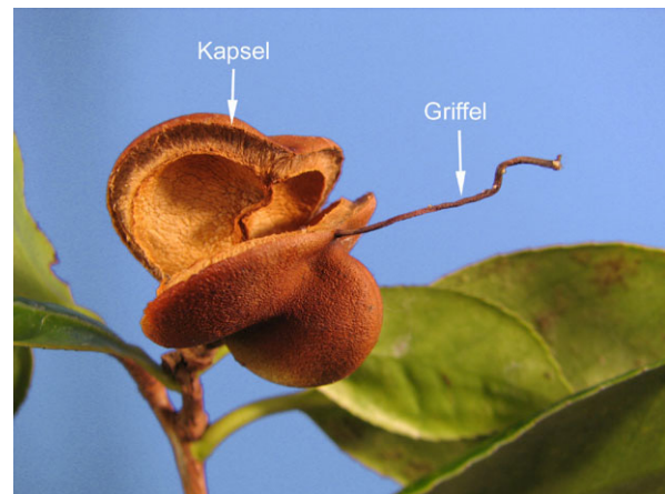
Abb. 10: Camellia japonica , reife, sich klappig öffnende Kapsel Frucht.

Die Früchte der Kamelien sind stark verholzte Kapseln, die sich 2- bis 3-klappig öffnen (Abb. 9 & 10). Jede Kapsel Frucht enthält nur wenige, große Samen.