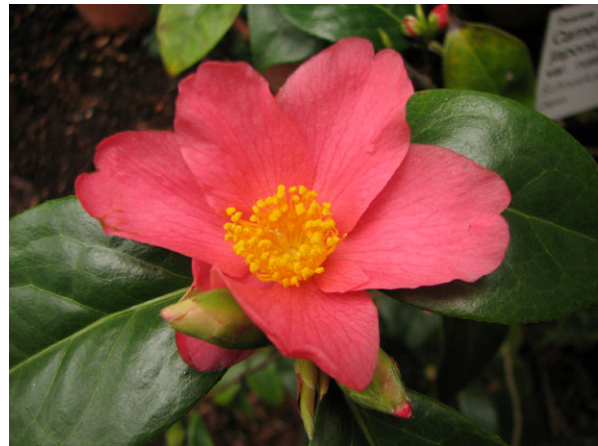
Abb. 6: Camellia japonica var. rustica , Blüte einer frosthärteren Varietät der Wildform aus Gebirgslagen Honshus/Japan (V. M. DÖRKEN).

Bei den Kamelien, die bei uns unter der Bezeichnung Camellia japonica angeboten werden, handelt es sich aber nicht um Wildformen, sondern durchweg um gärtnerische Züchtungen. So existieren neben Sorten mit unterschiedlicher Blütenfarbe und Blütengröße auch halb- bis