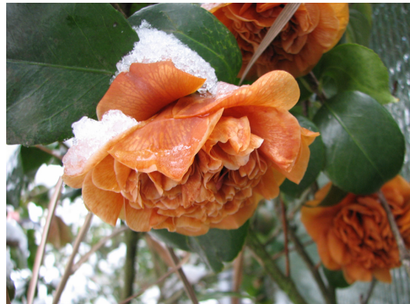
Abb. 14: Camellia japonica (Sorte), frostgeschädigte Blüte der Pflanze in Abb. 13, die Blüte ist ausgefärbt (V. M. DÖRKEN).

Bei der Kultur ist einiges zu berücksichtigen, damit die Pflanzen sich gut entwickeln und zur Blüte gelangen. Der Boden muss gut durchlässig sein, der optimale pH-Wert liegt zwischen 4,5 und 5 (zum Beimischen eignet sich Rhododendron-Erde). Der Standort sollte lichtsattig bis schattig sein. Die Pflanzen müssen unbedingt vor Wintersonne und austrocknenden Ostwinden geschützt werden. Außerdem kann man die Pflanzen im Freiland durch einen Winterschutz, z. B. Abdecken des Wurzeltellers mit Mulch, Stroh, Laub oder Vlies schützen. In besonders rauen Lagen müssen auch die oberirdischen Pflanzenteile zusätzlich mit Schilfmatten oder Vlies vor Kälte geschützt werden. Im Freiland empfiehlt sich vor und nach Frösten ausreichend zu wässern, um Schäden durch Frosttrockenheit vorzubeugen.