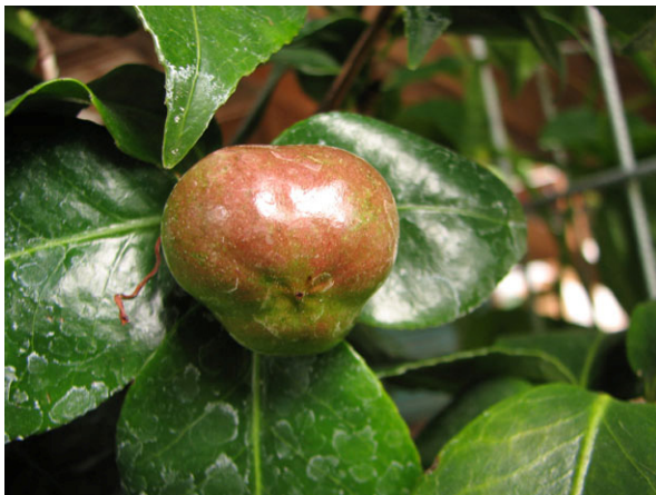
Abb. 9: Camellia japonica , unreife Kapsel Frucht (V. M. DÖRKEN).