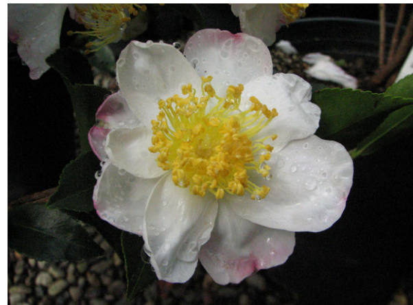
Abb. 2: Camellia sasanqua 'Hana Jiman' (V. M. DÖRKEN).