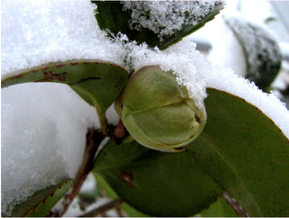
Abb. 3: Camellia japonica (Sorte), Blütenknospe mit Schnee (V. M. DÖRKEN).