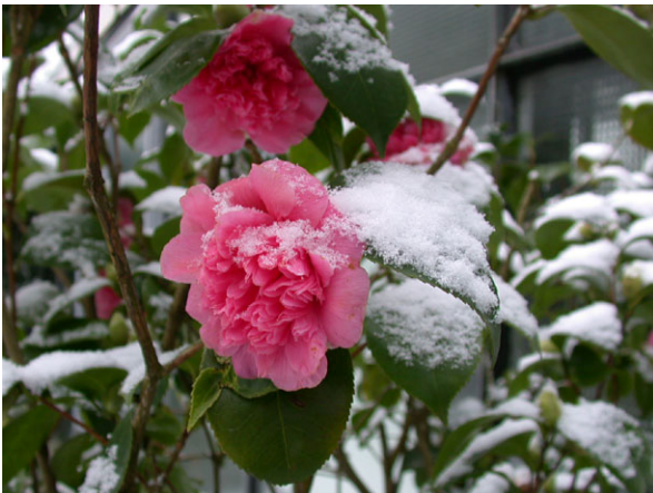
Abb. 13: Camellia japonica (Sorte), Blüte nach frischem Schneefall.