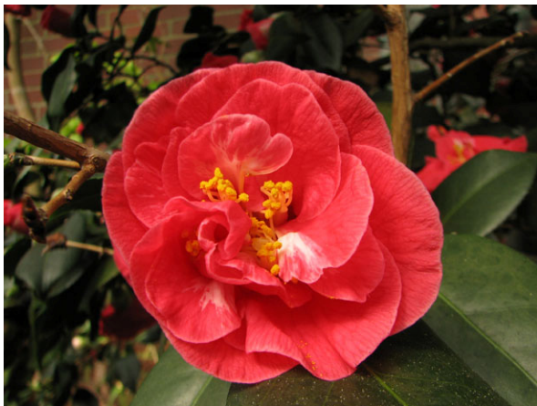
Abb. 1: Camellia japonica 'Bealei Rosea' mit halbgefüllter Blüte.

Kamelien haben ausgesprochen attraktive Blüten und blühen im Winter, weswegen man sie auch "Rosen des Winters" nennt. Bei den Kamelien, die bei uns im Gartenhandel angeboten werden, handelt es sich in den meisten Fällen um Sorten der Japanischen Kamelie ( Camellia japonica ). In Ostasien fand die Art in der Gartenkultur als Blütensolitär schon sehr lange Verwendung, bevor sie Anfang des 18. Jahrhunderts auch nach Europa gelangte. In den letzten Jahren werden Kamelien zunehmend auch in deutschen Gartencentern und sogar im Sortiment von Lebensmitteldiscountern angeboten. Neben Camellia japonica und deren Sorten (Abb. 1) haben auch Camellia hiemalis , Camellia oleifera , Camellia sasanqua (Abb. 2) sowie viele Hybriden eine größere Bedeutung.