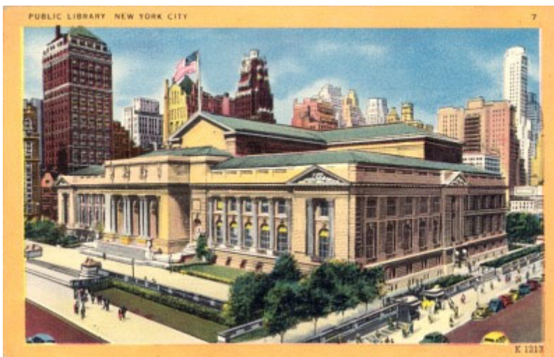
Massive Insel im Meer aus Beton: Die New York Public Library. Für eine größere Ansicht (ca. 320 kB) bitte dem Link folgen.

Sie begnügt sich damit, die alte Handschrift prinzipiell und überhaupt weltweit verfügbar zu machen und entkleidet sie damit ihres Kontextes, der doch allererst die Spur legt, in deren Verfolgung man so etwas wie eine Ahnung vom kulturellen Wert der Handschrift gewinnen könnte. Ohne diese Spur aber bleibt die Handschrift weniger ein Unikat als ein Unikum, das im höchsten Fall einen ästhetischen Reiz vermittelt, nicht anders als die afrikanischen Masken, die sich wohlmeinende Bürger in ihr Wohnzimmer stellen, ohne eine Ahnung davon, daß sie damit einem Voodoo-Zauber die Tür geöffnet haben.