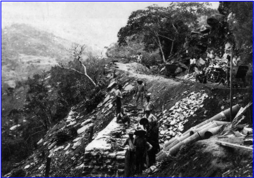
Abb. 3: Fotografie vom Bau der Eisenbahnstrecke zwischen Matadi und Kinshasa, die 1890 begonnen und 1898 abgeschlossen wurde. In Arbeit ist hier der fünfte Streckenkilometer. Aus: Blanchart, Le Rail au Congo Belge (wie Anm. 64), S. 105.

ground, a puff of smoke came out of the cliff, and that was all. No change appeared on the face of the rock. They were building a railway. The cliff was not in the way or anything; but this objectless blasting was all the work going on. (S. 32 f.)