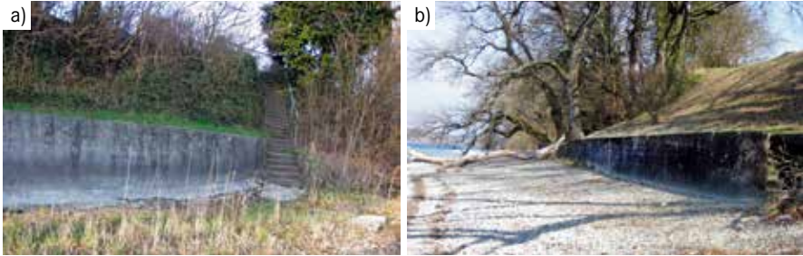
Abbildung 2: Ufermauer am Bodensee-Untersee – Szenario B: (a) südostexponierte Stützmauer an einem erosionsgefährdeten Uferabschnitt südlich Hornstaad mit einer Vorland-Vegetation aus schüttereren Schilf- und Rohrglanzgrasbeständen; deutlich zeichnen sich die vorjährigen Maximalwasserstände ab (Gemarkung Horn;); (b) nordexponierte Stützmauer in Mammern (Spanacker); infolge der Beschattung durch Bäume ist das Vorland nahezu vegetationsfrei.

und beschränken sich überwiegend auf die sommerliche Ferienzeit, beeinträchtigen die Habitate also nur unwesentlich. Die seeseitigen Nutzungen erstrecken sich auf die Berufsfischerei (Reusenanlagen) sowie auf die Linienschifffahrt, deren Schiffe von Anfang April bis Ende September bis zu acht Mal täglich in etwa 300 m Uferentfernung mit der zulässigen Höchstgeschwindigkeit 3 an den Uferstrecken vorbeiziehen.