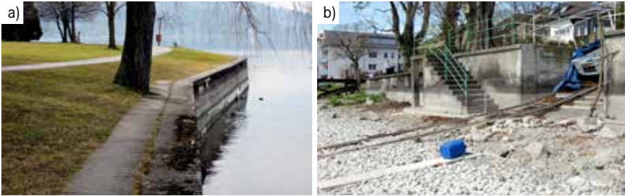
Abbildung 3: Ufermauern am Bodensee-Untersee – Szenario C: (a) langgestreckte, knapp 3 m hohe Gussbetonmauer westlich Steckborn/Ortsteil Fäldmeilen mit hinterliegendem Uferpark ; (b) Ufermauern mit landseitigen Wohngebäuden und intensiver seeseitiger Nutzung am Südufer der Insel Reichenau/Ortsteil Mittelzell.

rungen durch Gartenpflege, Bau- und Ausbesserungsarbeiten sowie durch Freizeitaktivitäten bis in die Abendstunden (Grill- und Strandpartys) einschliesslich des zugehörigen Lichtsmogs. Seeseits der Mauer wird gebadet, Surfbretter und andere Wassersportgeräte werden zu Wasser gelassen, Bootsmotoren werden gestartet und Boote legen ab. In etwa 300 m Abstand zum Ufer verkehren Fahrgastschiffe wie im Szenario B. Im Winter, bei niedrigem Wasserstand, kommen Strandwanderer vorbei, während Gemeinden und Private das Vorland reinigen («Seeputzete») und mit Kies neu eindecken oder auffüllen.