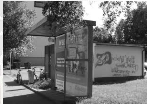
Bushaltestelle im Berchengebiet

drehen sich die Fragen um soziale Problemlagen, um Jugendliche ohne Raum, um die Verlagerung bzw. Auslagerung von Problemgebieten durch entsprechende Verbote und Sperrzeiten.