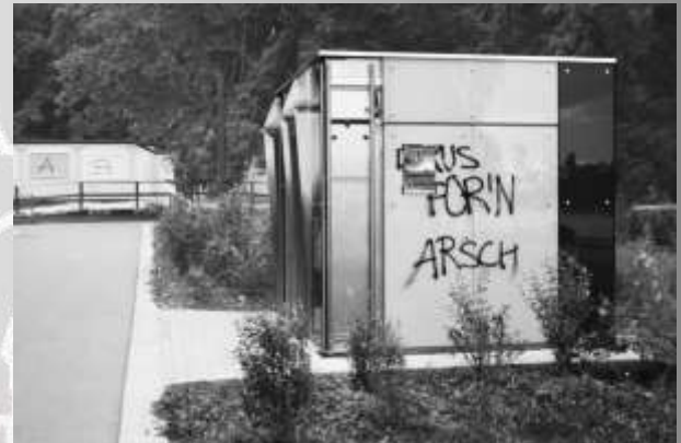
Toilettenhäuschen am Herosé, fotografiert im Juli 2010

geplant aber nicht gebaut, stattdessen repräsentative Toilettenhäuschen – „Luxus für’n Arsch“.