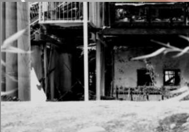
Ausgebrannter Kindergarten, fotografiert im Juni 2010

Unser Interesse am Thema Sicherheitswahrnehmung in Konstanz entstand bereits vor den Kriminalfällen des Sommers 2010 in und um Konstanz (Taxi-Mord, Vergewaltigungen, Brandstiftung und Vorfälle im Hockgraben). Dennoch hatten diese Ereignisse Einfluss auf unsere Arbeit. Zum einen führte dies dazu, dass sich die von uns befragten BürgerInnen weniger skeptisch gegenüber unserem Projekt verhielten und sich eher bereit erklärten, unsere Fragen zu beantworten. Diesem Zugewinn an Relevanz für unsere Studie stand allerdings auch eine Einschränkung in der Umsetzung unserer Pläne gegenüber. Der ursprüngliche Plan, eine Polizeieinheit einen oder mehrere Tage auf der Streife zu begleiten, um mit ethnologischem Blick deren Wahrnehmung und Arbeit zu beschreiben, ließ sich aufgrund der genannten Vorfälle leider nicht realisieren.