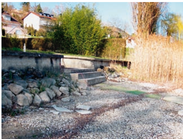
Abb. 7: Vorlandnutzungen am Untersee-Ufer.

Oben: Beseitigung von Schilfbeständen; vor dem hinteren Teil des Mauerabschnitts hat sich noch ein Schilfbestand erhalten, vor dem vorderen Teil der Mauer wurde er bereits beseitigt (westlich Wangen, 29.03.2011).