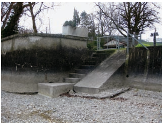
Abb. 3: Ufermauern und Vorschüttungen.

Die landseitigen Aktivitäten finden hauptsächlich an Wochenenden zwischen März und Oktober statt. Dann kommt es zusätzlich zu den strukturellen Veränderungen zu Störungen durch Gartenpflege-, Bau- und Ausbesserungsarbeiten sowie durch Frei-