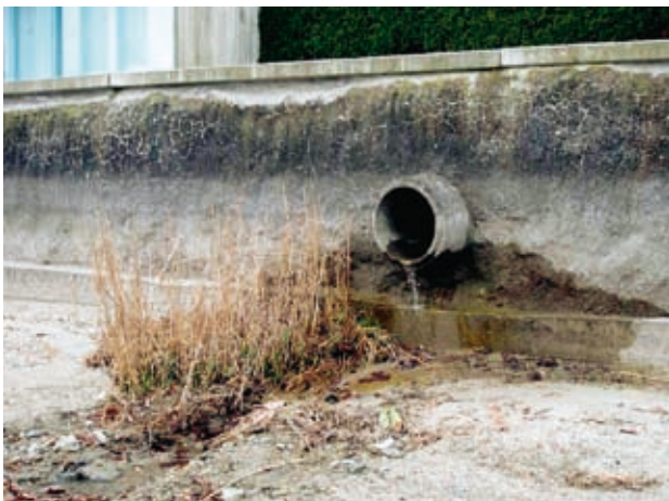
Abb. 5: Beseitigung mikro- skaliger Lebensraumstrukturen.

Oben: ausgefugte Blockstein- mauer mit Moosen, Farnen und Zimbelkraut ( Cymbalaria muralis ) neben einer Gussbetonmauer ohne Vegetation (Wasserburg, Lkrs. Lindau, 06.03.2007).