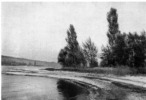
Abb. 2: Unverbaute Ufer am Untersee.

Oben: Ufer am Langhorn östlich Mammern mit schmalen Röhricht- und Gehölzgürtel bei herbstlichem Niedrigwasser, um 1907 ( \pm 2 Jahre) (BAUMANN 1911, Taf. IIa).