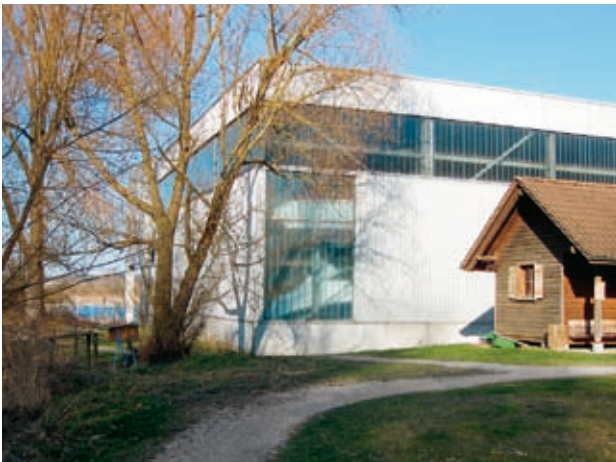
Abb. 6: Hinterlandanbindung des Untersee-Ufers.

Oben: uferparallele besiedlungsfeindliche Strukturen (Eisenbahntrasse, asphaltierter Fahrweg und geschotterter Fussweg) auf einer Aufschüttung des 19. Jahrhunderts verhindern eine Anbindung der Uferlebensräume an das Hinterland (Radolfzell, 02.05.2011).