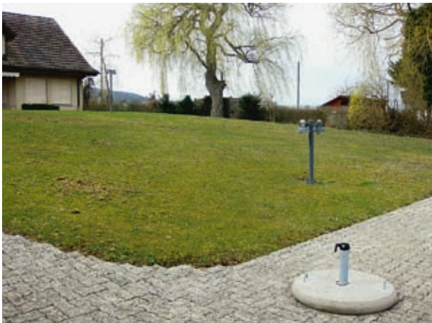
Abb. 4: Freizeit-Parzellen hinter Ufermauern.

Oben: extensiv genutzte Parzelle mit teilweise erhaltenem Gehölzbestand (Mammern, Langhorn, 25.03.2011).