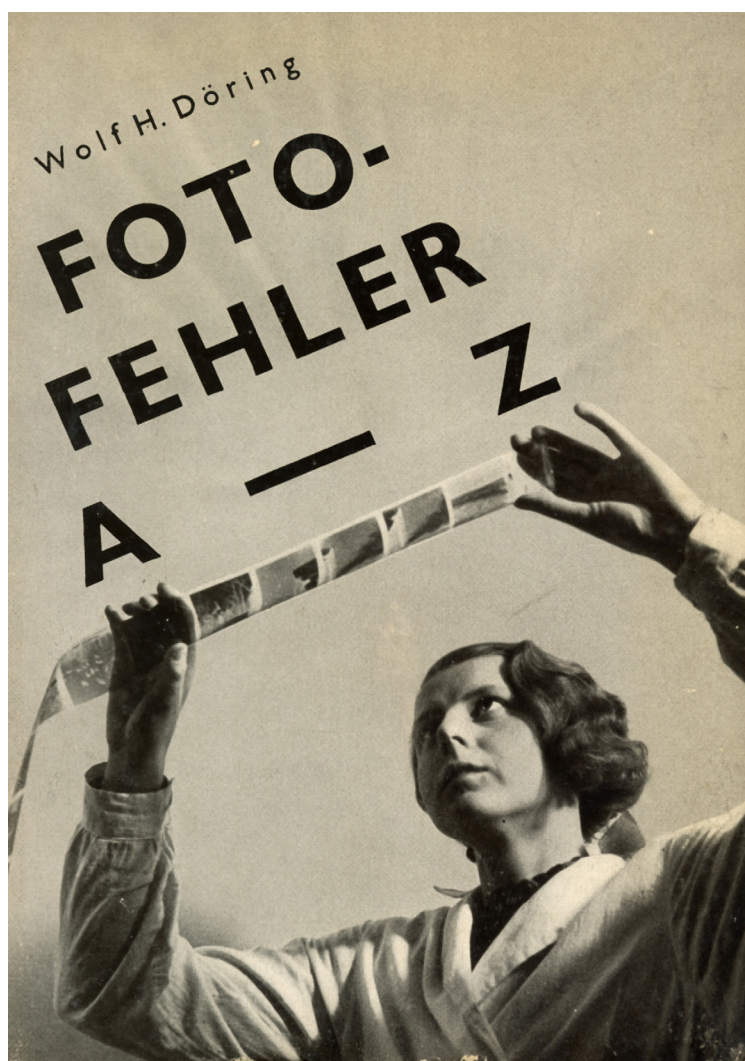
Couverture de Wolf H. Döring, Fotofehler A bis Z , Halle an der Saale, Wilhelm Knapp, 1933.

Envisageons quelques exemples afin de préciser ce type de manuel. L'éditeur Wilhelm Knapp, dont le nom figurait parmi les collections les plus répandues dans le monde des amateurs, a publié toute une série de mémentos orthophotographiques. Citons par exemple, en 1905, Die Mißerfolge in der Photographie und die Mittel zu ihrer Beseitigung 2 (Les échecs en photographie et les moyens pour les éviter) d'un certain Hugo Müller qui reprend la structure de Schmidt ou, en 1933, l'abécédaire Foto-Fehler A-Z (Les fautes photographiques de A à Z) de Döring.