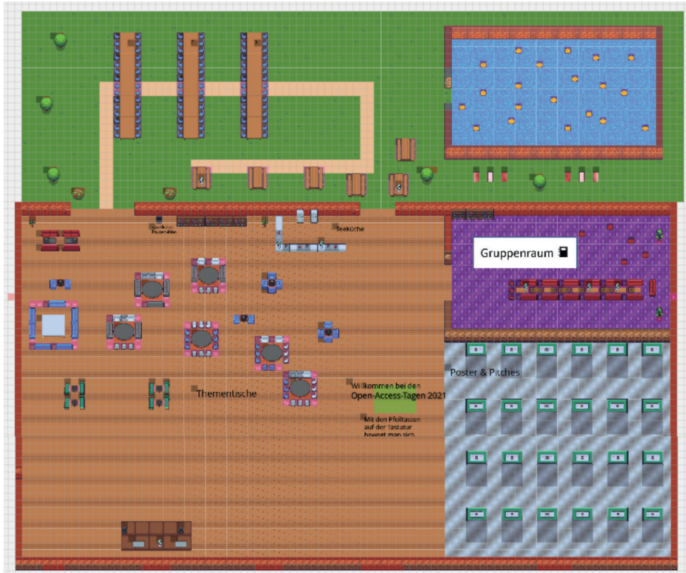
Abb. 1: Eine Übersichtsdarstellung des Gather-Raums für die Open-Access-Tage 2021.

somit eine zeitlich ungebundene Nutzung der Inhalte ermöglicht, unterstützt letzteres besonders sozial-interaktive Momente gut.