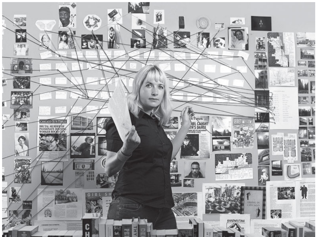
Abb. 4: Lauren Beukes Portrait im Portrait bei Wired (Cheshire 2013).

Die südafrikanische Autorin Lauren Beukes wurde für die Vorstellung ihres Kriminalromans im Magazin Wired beispielsweise vor einer recht strukturierten Pinnwand gezeigt. (Abb. 4) Nicht nur ist die Wand Zeugin für die Komplexität der Handlung, das Beispiel ist hier noch von besonderem Interesse, da sie ihre Leser*innen mit dem folgenden Text adressiert: „SPOILER ALERT, obviously, [...] this was also one version back before the final draft, which means a couple of the notecards in the middle section, which is the book’s timeline, may be ever so slightly off, if you’re geeky like that.“ (Homepage Beukes, 7. Dezember 2021) Damit verrät die Pinnwand die Handlung des Buches (und spoilt demnach), Beukes nimmt zudem auch die mangelnde Kongruenz zwischen Pinnwand und Roman vorweg, die ihr negativ angekreidet werden könnte. Und sie bezeichnet jene Leser*innen, denen dies auffallen könnte, als geeky . Die besondere Aufmerksamkeit, die wie eben erwähnt zu Belohnungen im Verständnis des transmedialen Erzählens führen kann (Mittell 2015, 227), ist für Beukes also etwas seltsam, das vertiefte Interesse eher die Ausnahme, wenn auch sicherlich nicht negativ bewertet. Die hier mitschwingende Unterstellung einer genauen Analyse einer Pinnwand ist aber genau das, was diese für Überlegungen zu Following so interessant macht.