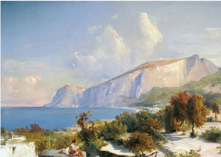
Carl Blechen, Nachmittag auf Capri (1829)

Neben den vielen kritischen Reaktionen gab es allerdings auch »anerkennende Rezensionen« (Nicolai 1835: 363), in denen Nicolai als Retter, »Märtyrer der Wahrheit« (Anonymus, zit.n. ebd.: 389) 33 gepriesen wird, der als »Erster ausspricht, was alle längst gefühlt, aber nicht den Mut gehabt, zu sagen« (Anonymus, zit.n. ebd.: 370). 34 Das übertriebene Lob wirkt dabei fast parodistisch: