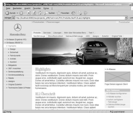
Abbildung 2: Detaillierter Prototyp

Zur Verfeinerung der Prototypen und zur Evaluierung ausgearbeiteter Navigationselemente und Layouts, kann der UE-Experte Templates erzeugen und diese mit detaillierten Inhalten anreichern (Abbildung 2).