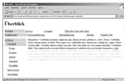
Abbildung 1: Abstrakter Prototyp

Während der Entwicklung der Webseite von MB haben wir MAXpro für das frühe Entwickeln von Prototypen verwendet (siehe Abbildung 1). Durch die Modellierung einer Navigationsstruktur, der Benennung von Navigationspunkten und der Verknüpfung zu Blindtexten entsteht bereits ein abstrakter Prototyp der späteren Webseite. Die frühe Simulationen dient nun dazu, Diskussionen mit beteiligten Akteuren während Workshops zu führen und Evaluationen mit Endbenutzern vorzunehmen. So werden z.B. optimale Navigationspfade bestimmt und die Position einzelner Webseiten im Informationsraum erörtert.