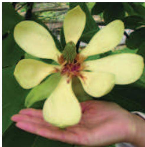
Abb. 13 (oben): Magnolia x soulangiana , Frostschaden.