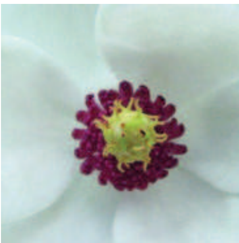
Abb. 16 (oben): Magnolia kobus .

Die aus Japan stammende Stern-Magnolie ist ein häufig gepflanztes Blütensolitär mitteleuropäischer Gärten. Sie ist ein recht langsamwüchsiger Strauch, der erst nach Jahren Höhen von 3–4 (–5) m erreicht. Die Triebe und besonders die Blütenknospen sind dicht silbrig behaart. Die 5–15 cm langen und 3–5 cm breiten, schmalen, verkehrt-eiförmigen Blätter sind oberseits dunkelgrün und unterseits heller und nur gelegentlich leicht behaart. Die etwa 10–15 cm breiten,