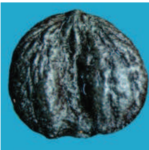
Abb. 10 (oben): Magnolia tripetala , Frucht.

Diese Magnolienart ist im Hügelland und in den Vorbergen Japans heimisch und erreicht dort Höhen von bis zu 25 m. In Kultur bleibt die Art meist deutlich kleiner. Die Krone ist mehr oder weniger rundlich. Die Äste stehen dabei entweder aufsteigend oder ausgebreitet. Die Triebe sind kahl, die Blattknospen sind wenig, die Blütenknospen aber stark silbrig behaart. Die