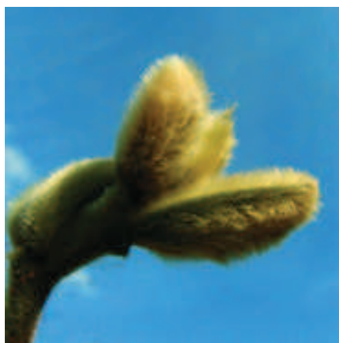
Abb. 1 (oben): Liriodendron tulipifera .