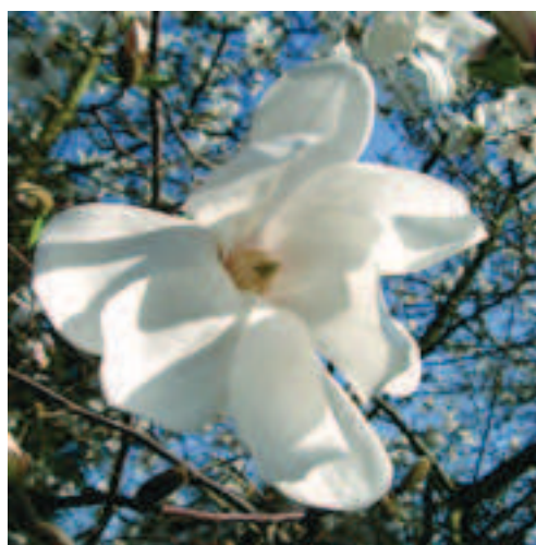
Abb. 19 (oben): Magnolia sieboldii ssp. sinense .